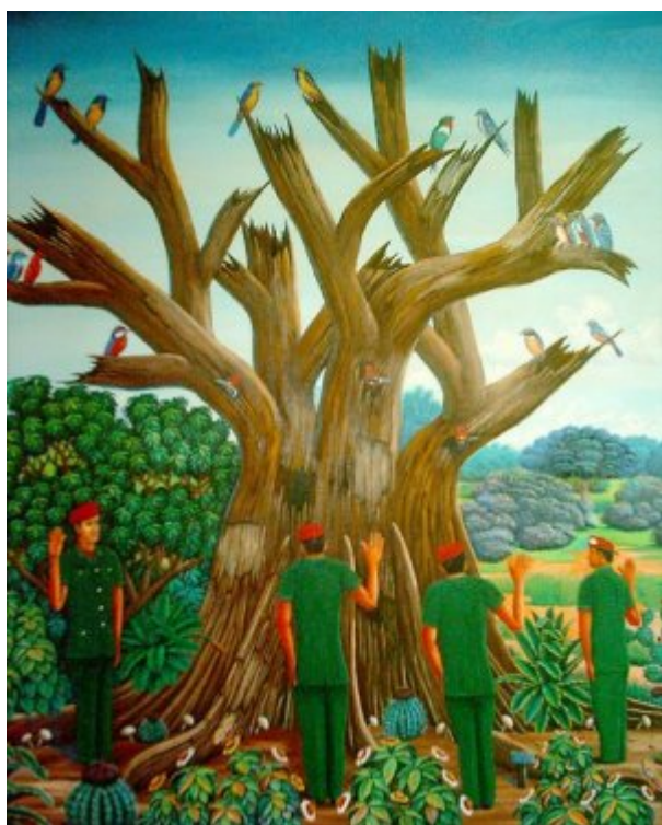
Aryssasi (Venezuela), Juramento del Samán de Güere , 2008.

En 1989, mientras una muchedumbre entusiasta recoge los escombros del muro de Berlín, el pueblo venezolano está de pie en la calle para decir no a las medidas de austeridad impuestas por el FMI y por el socialdemócrata Carlos Andrés Pérez. La represión deja 3000 muertos. Al mismo tiempo el ejército estadounidense invade Panamá y masacra miles de civiles. Estos crímenes contra la humanidad, impunes, ocultados por los grandes medios, indignan a unos militares de extracción popular como Hugo Chávez quienes deciden resucitar la frase de Bolívar: " maldito sea el soldado que dispara contra su pueblo ". Rechazan todo tipo de pinochetismo y denuncian la ideología entonces dominante del " Fin de la Historia ".