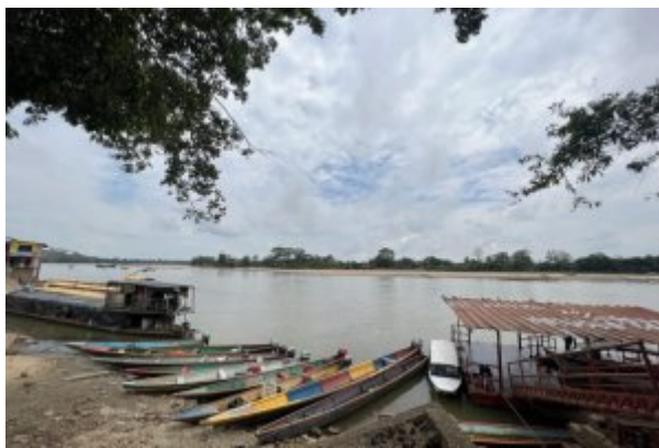
Petit port à Cartagena del Chairá